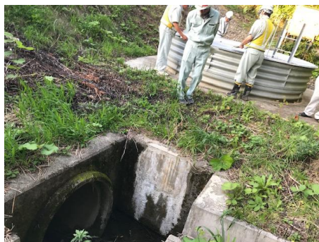
写真3 常盤災害防除工事 場所打杭工施工箇所（左），山側の集水井と既存排水施設（右）