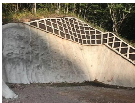
写真2 新稲穂トンネル掘削前状況